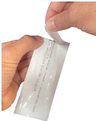
Afbeelding 3. Opengemaakte folieverpakking