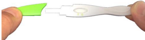
Afbeelding 4. Sensitest ovulatietest LH-midstream