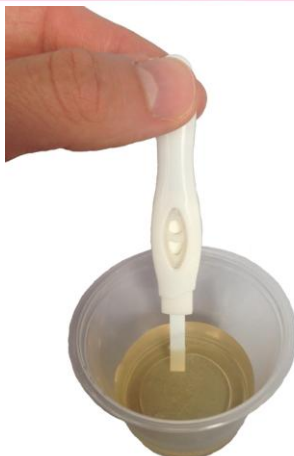
Afbeelding 5. Ovulatietest in het bakje met urine