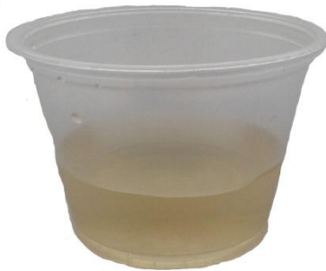
Afbeelding 2. Bakje met opgevangen urine