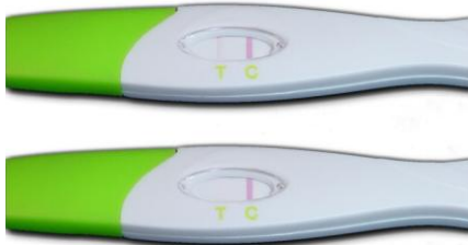
Geen LH-piek - Negatief

Het resultaat is negatief als er 1 roze lijn verschijnt. Dit is de controlelijn (C) om te zien of de test juist is uitgevoerd. Indien testlijn (T) niet zichtbaar is of zeer licht roze verschijnt heeft het lichaam nog onvoldoende LH aangemaakt om te kunnen spreken van een LH piek. De test kan als negatief worden geïnterpreteerd.